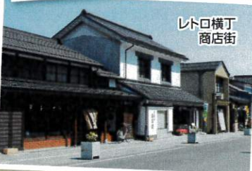
レトロ横丁 商店街